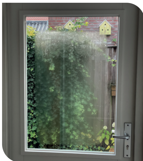
Condensvorming aan de kamerzijde.

Condensvorming aan de kamerzijde ontstaat meestal bij een lage buitentemperatuur en een hoge relatieve luchtvochtigheid in de woning. Het aanwezige vocht condenseert dan tegen het glasoppervlak. Bij isolerende beglazing met een goede isolatiewaarde zoals Hoog-Rendements isolerend dubbelglas is dit risico kleiner dan bij glas met een slechte isolatiewaarde zoals enkelglas. Dit is ook afhankelijk van de specifieke situatie. Belangrijk is te weten dat condens aan de kamerzijde geen fout in het product is. Eventuele condensvorming is te voorkomen door goed te ventileren. Zeker als u uw bestaande beglazing laat vervangen is het zaak goed te kijken naar mogelijkheden om te ventileren.